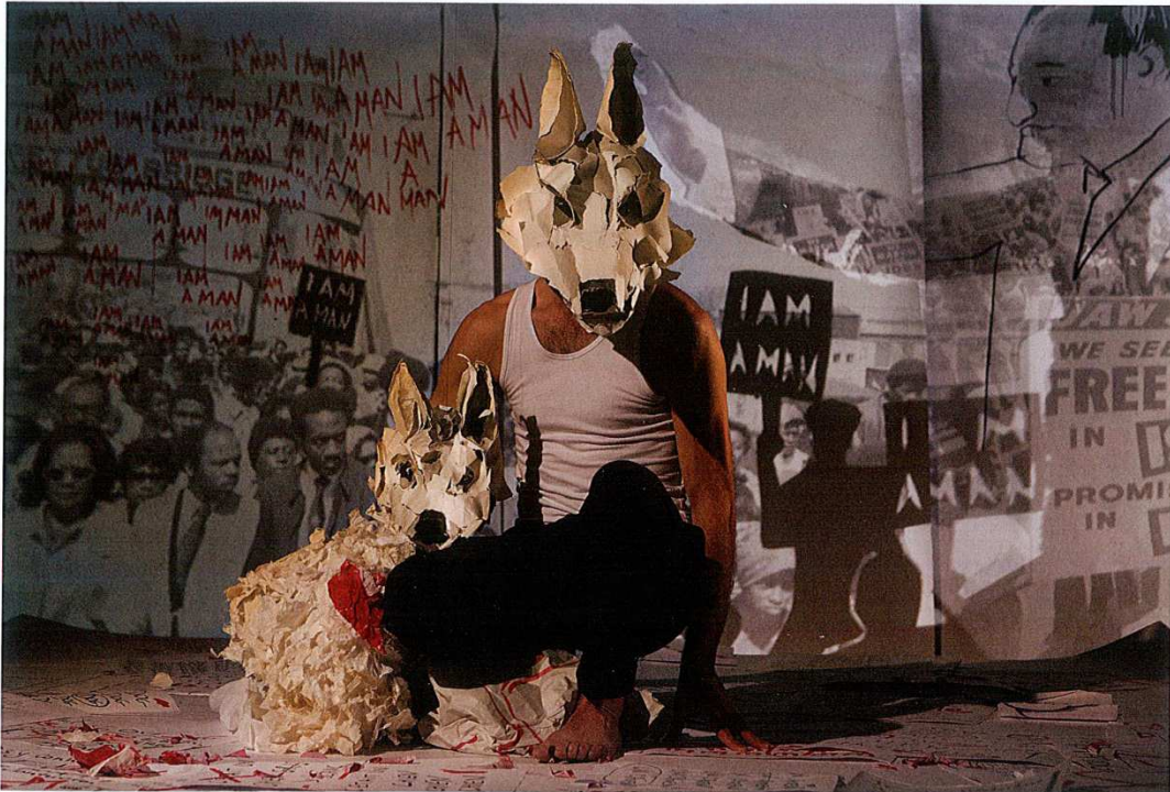
White Dog