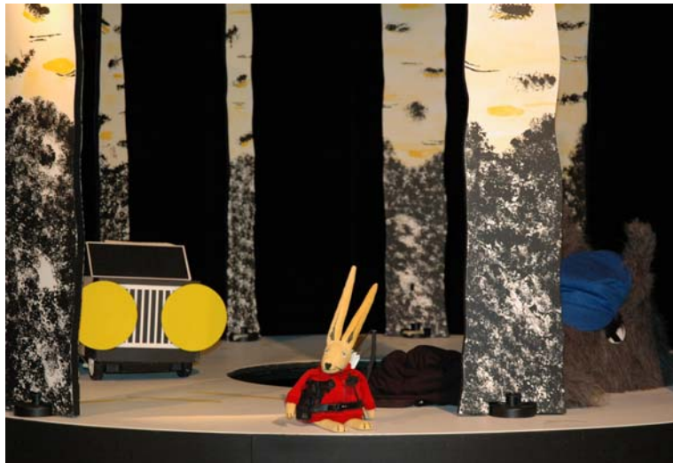
Ne m'appellez plus jamais mon petit lapin

Chine Curchod : L'histoire imaginée par Grégoire Solotareff est dénuée de manichéisme et contient plusieurs dimensions déjà présentes dès le dessin de couverture de l'album. On y voit la figure principale habillée du manteau carmin des contes, Jean Carotte, son petit corps et ses oreilles démesurées. Une larme coule sur sa joue alors qu'il tient un arc à la patte et porte un carquois emplies de flèches. Alors que son futur ami plus menu encore que lui, Jean Radis, porte un habit vert, Carotte affiche le rouge. On peut déjà apprécier dans ces contrastes de couleurs, une manière d'afficher des caractères immédiatement reconnaissables pour les enfants. Solotareff conçoit souvent ses histoires avec des figures fonctionnant par paires, couples avec une animalité très humaine dans les comportements et les espérances. N'a-t-il pas imaginé ailleurs un chaperon vert se frottant au mythique petit chaperon rouge ?